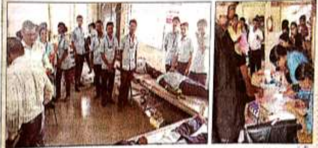
रक्तदान शिबिर, औरंगाबाद