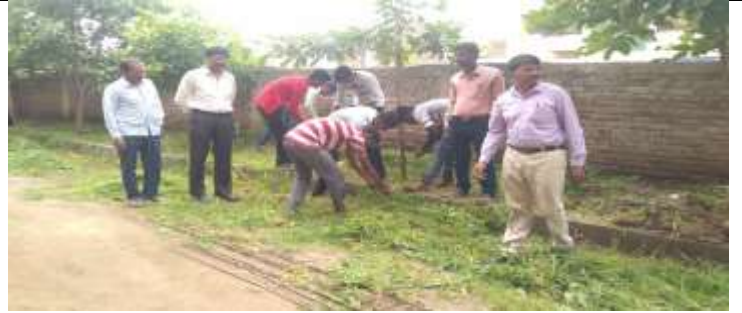
Cleanliness of College Campus