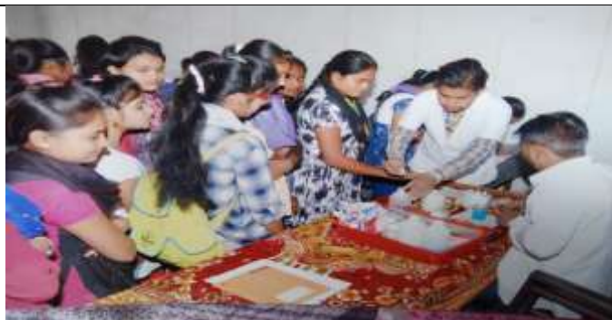
Health Checkup of College Girls