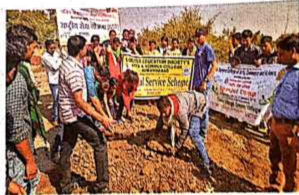
हस्तुल : गेवराई कुबेर गावातील रस्त्याची दुरुस्ती करताना विद्यार्थी व नागरिक.

गेवराई कुबेर या गावात रासेयोच्या माध्यमातून रस्त्याचे काम हाती घेण्यात आले. औरंगाबाद माझ्यासाठी नव्हे तर तुमच्यासाठी हे रासेयोचे बोधकाव्य. ते स्वयंसेवकांना लोकांसाठी, सामाजिक बांधिलकीची जाणीव करून देते. तसेच निःस्वार्थ सेवेचा धागा देखील गुंफायला पाग पाडते. हेच सेवेचे ब्रीद समोर ठेवून, गेवराई कुबेर या गावाला जोडणारा तीन वर्षापूर्वीचा मुख्य ४ कि. मी.चा रस्ता स्वयंसेवकांनी दुरुस्त केला. रस्त्याच्या भेटेला काटेरी छुडपे वाडली होती. काटेरी छुडपे तोडून, लहान-मोठे खडे घुडपून स्वयंसेवक व गावकऱ्यांनी चांगला संदेश सर्वांना दिला. प्रागविकासात नागरिकांचा सहभाग किती महत्त्वाचा आहे हे दाखवून दिले. अवघ्या सहा तासांत परिसर स्वच्छ करण्यात