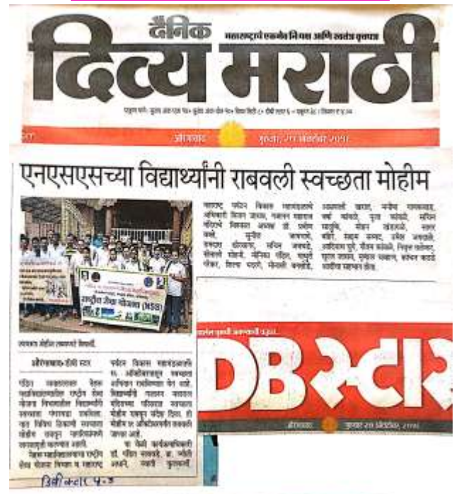
NSS volunteers during Cleanliness Drive at Gajanan Maharaj Temple on 24-10-2016