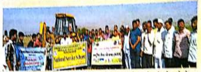
औरंगाबाद : गेवराई कुबेर येथील तीन वर्षांच्या चार किलोमीटर रस्त्याची दृढाती राष्ट्रीय सेवा योजनेच्या माध्यमातून करण्यात आली. यामेळी प्राध्यापक, प्राध्यापक, विद्यार्थी.