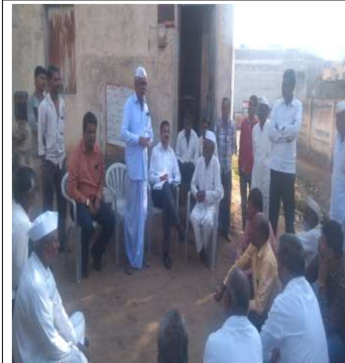
Meeting of NSS district Coordinator and Programme officer along with Volunteers and people for the village development at Gevrai Kuber Tq. & Dist. Aurangabad Village on 29-11-2018