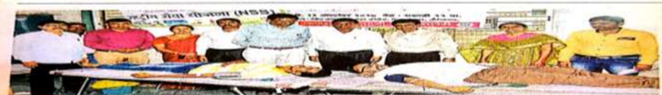
औरंगाबाद : शिबिरात रक्तदान करताना नेहरू महाविद्यालयाचे प्राध्यापक व विद्यार्थी.