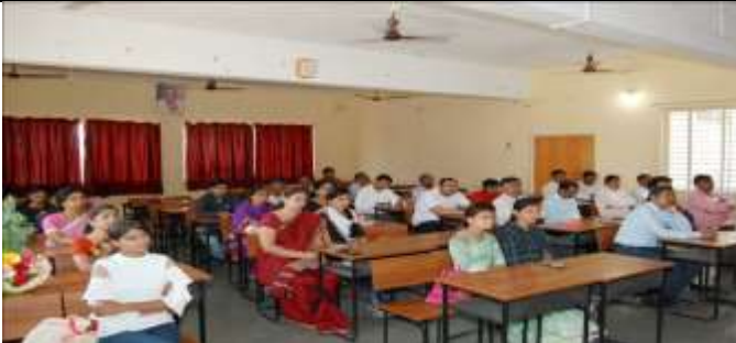
Staff and Students present during workshop