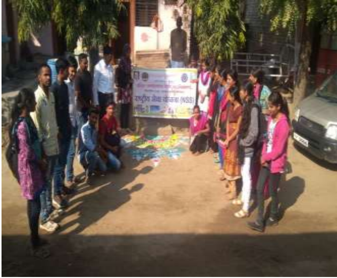
CLEAN HOME SWEE HOME