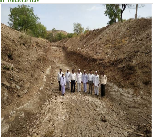
Digging work of Beldara Valley at Gevrai Kuber by NSS