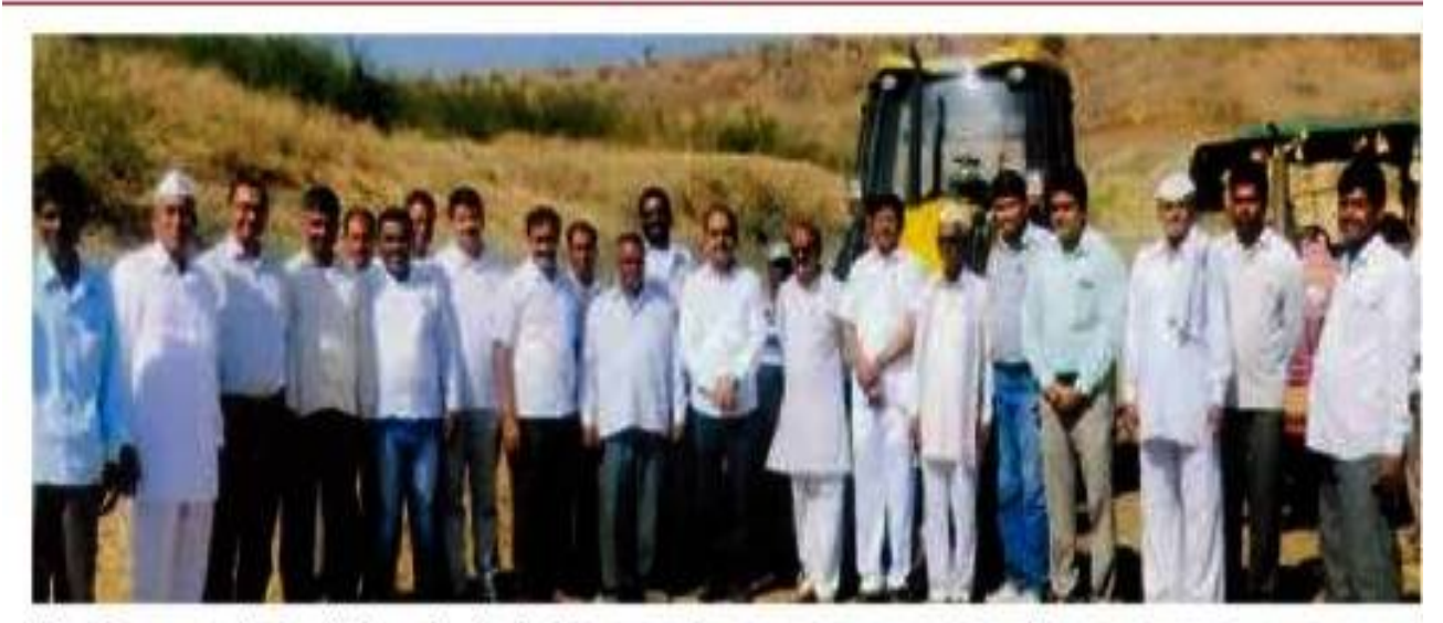
विद्यापीठाच्या रा.से.यो.तर्फे गेवराई कुबेर येथील तलावातील गाळ काढण्याच्या कामाचे उद्घाटन करताना मान्यवर.