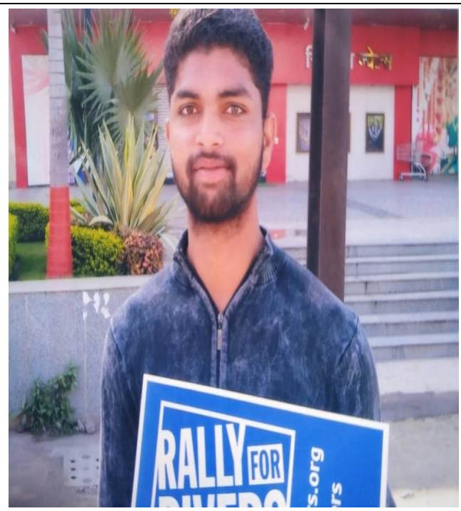
NSS Volunteers participated in the Rally for Rivers Campaign