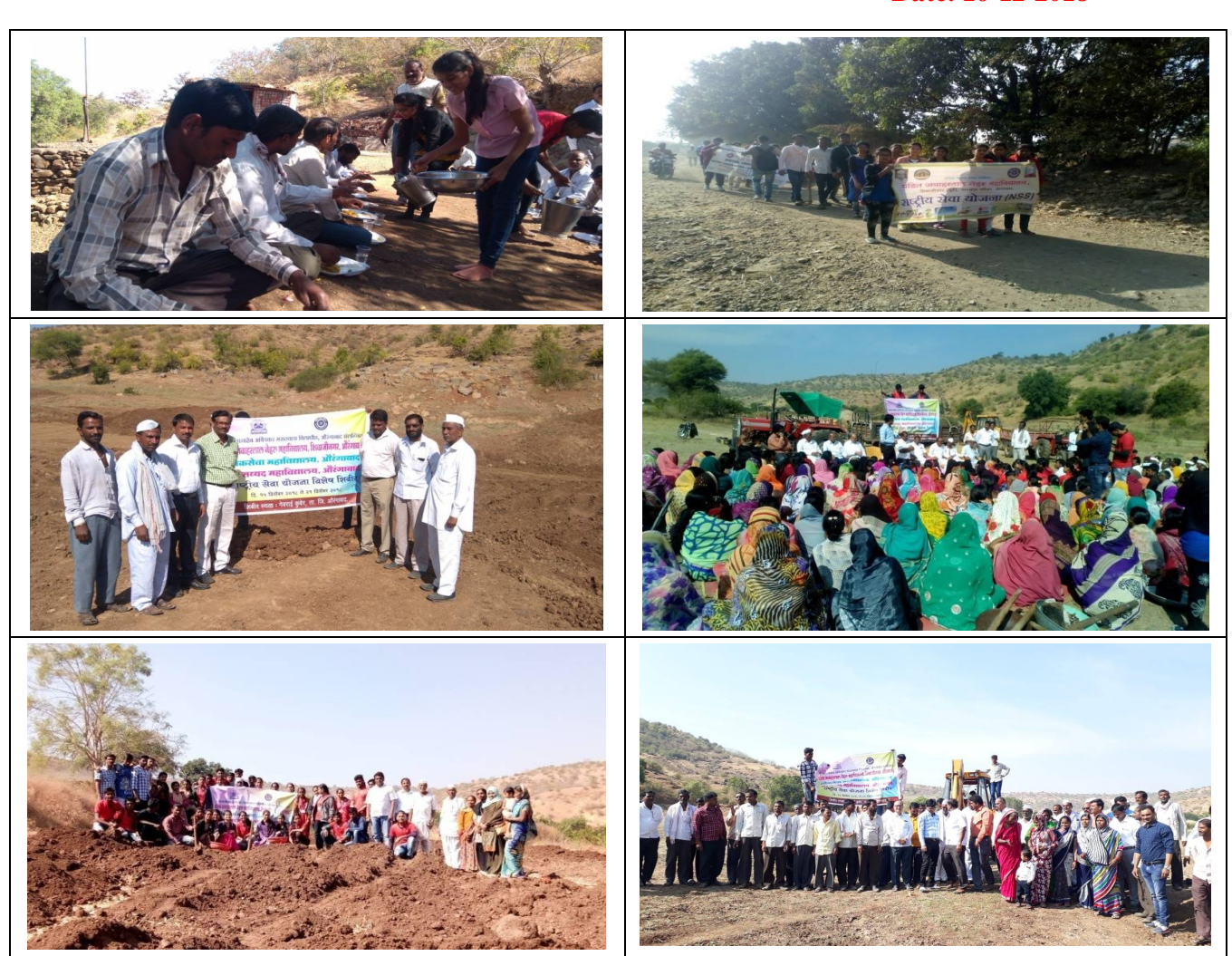
NSS Volunteers and Villagers doing work of Shramdan at Gevrai Kuber