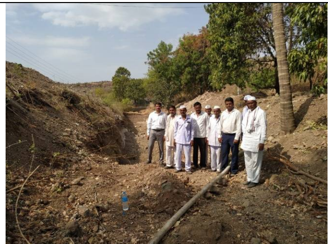
Digging of Sludge (Mud) at Gevrai Kuber