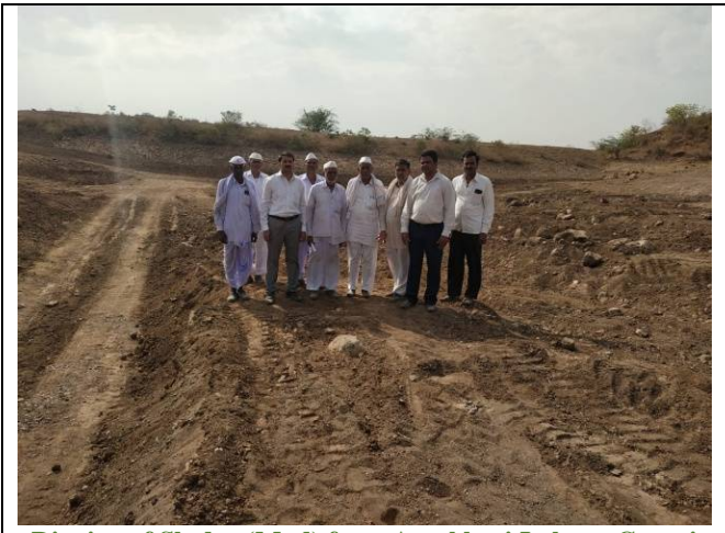
Digging of Sludge (Mud) from Aamkhori Lake at Gevrai Kuber