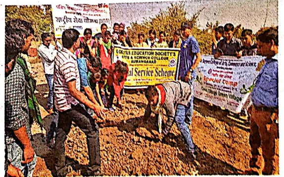
हुर्सूल : गेवराई कुबेर गावातील रस्त्याची दुरुस्ती करताना विद्यार्थी व नागरिक.

तसेच नि:स्वार्थ सेवेचा धागा देखील गुंफायला भागपाडते. हेच सेवेचे ब्रीदसमोर ठेवून, गेवराईकबेरयागावालाजोडणारातीसवर्षांपूर्वीचा मुख्य ४ कि. मी.चा रस्ता स्वयंसेवकांनी दुरुस्त केला. रस्त्याच्या कडेला कांटेरी झुडपे वाढली होती. काट्री झुडप तोङ्ग, लहान-मोठे खड्डे बुजवून स्वयंसेवक व गावकऱ्यांनी चांगला संदेश सर्वांना दिला. ग्रामविकासात नागरिकांचा सहभाग किती महत्त्वाचा आहे हे दाखवून दिले. अवस्या सहा तासांत परिसर स्वच्छ करण्यात